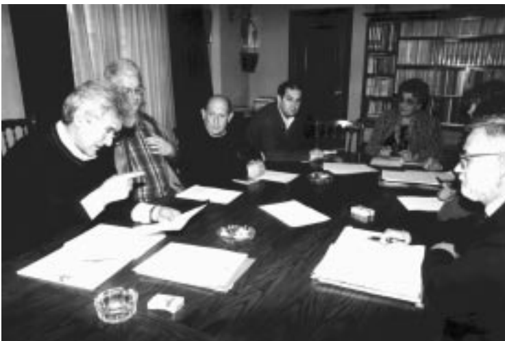
Ejecutiva Regional de Nafarroa.