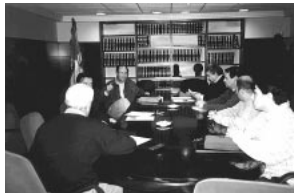
Ejecutiva Regional de Araba.