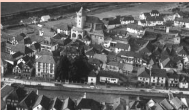
Otsagabia, Municipio del valle de Zaraitzu.